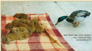
Nem lehet elég korán kezdeni ... vagy vadkacsa inból vizslavadászatra.

* Vadkacsapecsenye (vagy bármilyen vadmadár) konyhai maradványait, csontjait nem szabad a kutyának adni, mert – a nagyüzemi csirkékkel ellentétben – ezek csontja nagyon kemény és szilánkosra törik, életveszélyes belső sérülést okozhat!