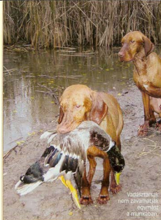
Vadászcsanak nem zavarhatják egymást a munkában.

Állóvízeknél, kisebb-nagyobb tavaknál folyó vadkacsavadászaton a sáros-nádas környezet intenzív keresőmunkát igényel a vízszlától. Ha nem húzás idején történik a vadászat, akkor a vízszla feladata a vízszelő nádas bejárása és az ott rejtő vadkacsák felrebbentése vagy nyílt vízre kitolása. Az állóvíz sokkal jobban megőrzi a víz felszínén a vadmadár szagát (az úgynevezett spúrt), mint a folyóvíz. Ha sebzett a madár, az úszó vízszla a spúron tudja követni, és szerencsés esetben egyből meg is tudja fogni. A kevésbé sérült vadkacsá azonban a tapasztalt vízszlát is teljesen ki