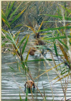
A hátsó kutya a fennakadt vadkacsát próbálja elérni.

Hideg időben nem tanácsos csónakból történő vadászatra kutyát vinni, mert úszás után a csónakba felvéve nem tudja magát futkározással fölmelegíteni.