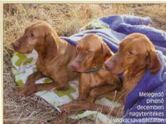
Melegdő pihenő decemberi nagyteretű vadkacsavadászaton.

A csónakból történő vadkacsavadászat a vízszla számára a melegebb őszi napokon kifejezetten élvezetes lehet. Ha kevés madarat lőttek, akkor hagyjuk, hogy a vízszla a dögre esetekért is vízbe ugorhasson, és feladhassa azokat a csónakba. Ha viszont sok madár esik, akkor a csónakos dolga, hogy csak a sebzetten után lapátoljon, és a kutya vízbe ugrása után a csónak megfelelő helyzetbe hozásával segítse a vízszlát. Akkor tudnak igazán jó eredményt elérni, ha „összedolgoznak”, mert a csónakos egyedül képtelen a sebzett és lebukó kacsák begyűjtésére, a csapkodó, menekülő madár után viszont fokozott vadászszemvéddel indul a vízszla. Nagyobb tavi vadászatokon a csónakosnak kell a kutya segítségére sietni, ha az a hínárba akadna.